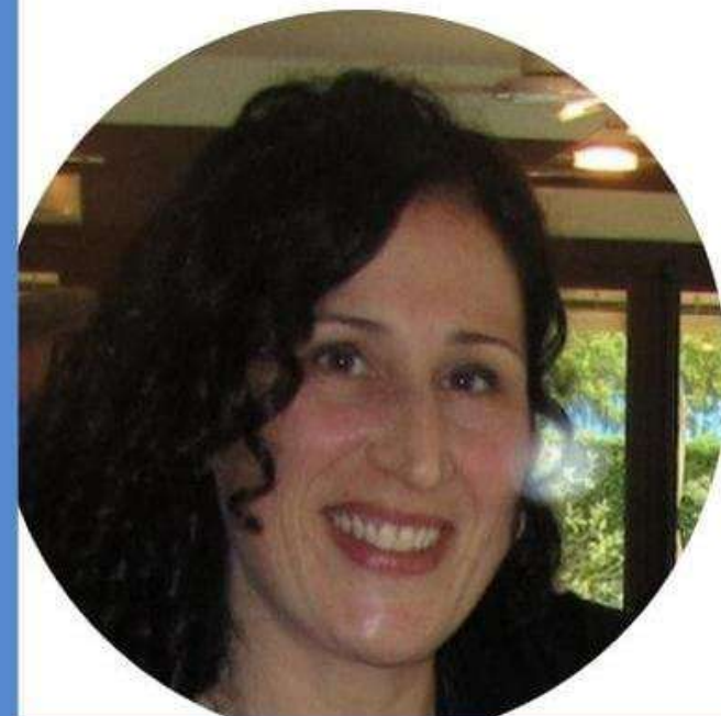
GIOVANNA TESTA SCUOLA PRIMARIA

Credo che il CSPI possa essere uno strumento per dare voce ai docenti e per costruire una scuola migliore per tutti. Se anche tu credi in questi valori vota per me, vota la lista "NOI SCUOLA BENE COMUNE"!