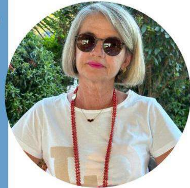
Michela Acconci Scuola Primaria

Ecco il perché della mia candidatura e la scelta di questo Sindacato che ha fatto proprie le lotte per una SCUOLA DEMOCRATICA, LIBERA che sappia dare dignità' alla professione degli insegnanti e che passi anche da una " giusta" riqualificazione economica.